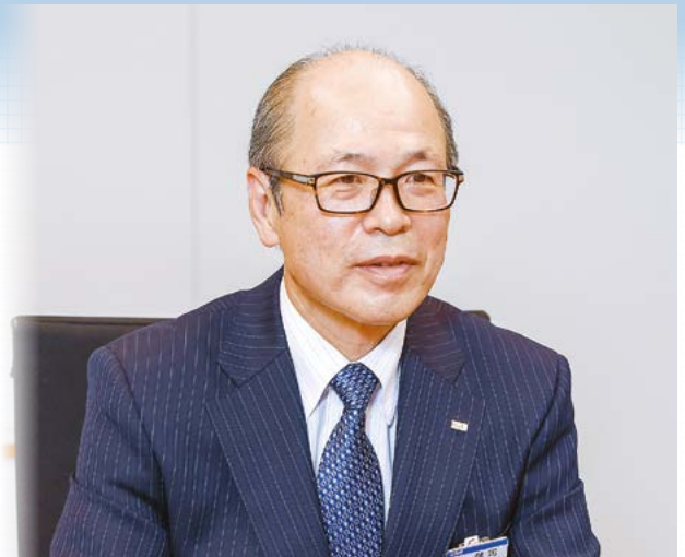
大日本印刷株式会社 代表取締役専務 新宿支部 支部長

「郷に入れば郷に従え、で、香港の国民性を重視しつつ、DNPのために働いてもらうにはどうすればいいか、試行錯誤しました。苦労もありましたが、日々生き生きと楽しく仕事ができ、大変勉強にもなりました。帰国後に新規事業開発部長という、私にすれば畑の違う分野で、知識豊富な技術者たちをまとめて新事業開発に貢献できたのも、この経験が活かされたからだ」と自負しています。